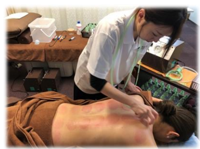
筋膜スライドカップング

吸玉の歴史、吸玉とは？など基本的な事から陰陽五行論を用いた東洋医学的な考え方や、西洋医学的な効果のメカニズムも学べます。